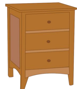
die Kommode, -n