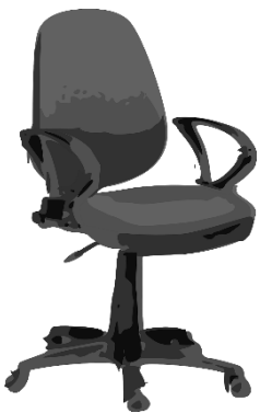
der Bürostuhl, "-e