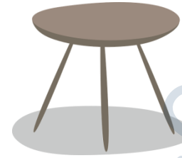
der Hocker, -