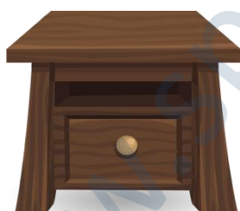
der Nachttisch, -e