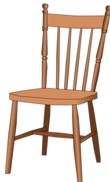
der Stuhl, "-e