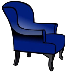
der Sessel, -