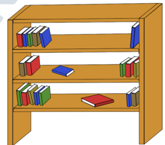
das Bücherregal, -e