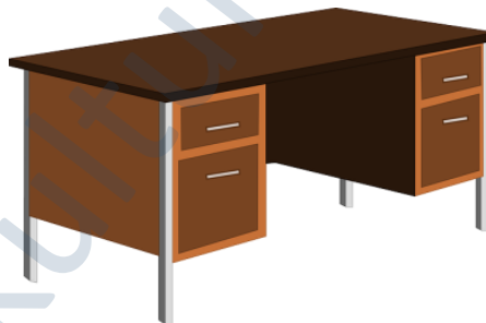
der Schreibtisch, -e