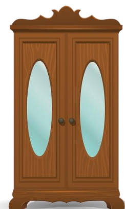
der Kleiderschrank, "-e