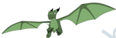
der Drache, -n