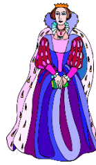
die Königin, -nen