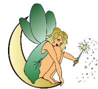
die Fee, -n