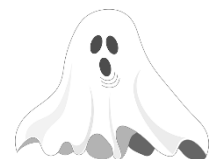
das Gespenst, -er