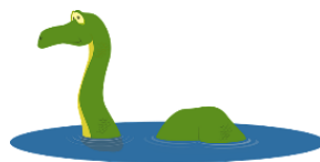
das Ungeheuer, --