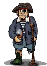
der Pirat, -en