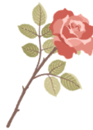
die Rose, -n