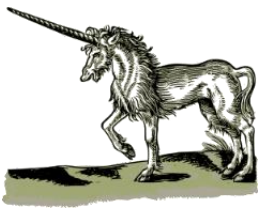
das Einhorn, -"er