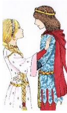
die Prinzessin, -nen/ der Prinz, -en