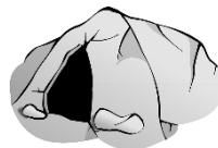
die Höhle, -