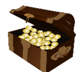
das Gold, -- in der Schatztruhe ( die )