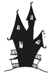
das Hexenhaus , -"er