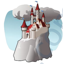
das Schloss, -"er