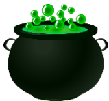
der Zaubertrank, -"e in dem Kessel ( der )