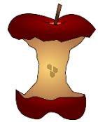
der vergiftete Apfel, -"