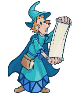
der Zauberer, --