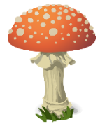
der Pilz, -e