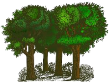
der Wald, -"er