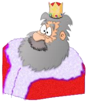
der König, -"e