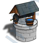
der Brunnen, --