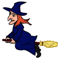
die Hexe, -n