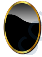
der Spiegel, --