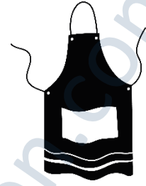
die Schürze, -n