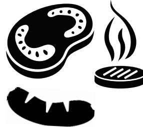
das Grillgut, -"er ( die Bratwurst, -"e das Steak, -s der Grillkäse, -)