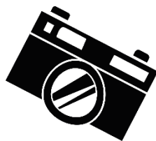
die Digitalkamera, -s