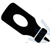
die Grillsoße, -n