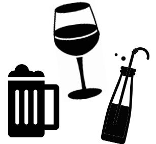
das Getränk, -e ( der Wein, -e das Bier, -e die Limonade, -n)