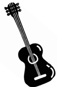
die Gitarre, -n