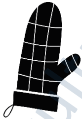
der Handschuh, -e