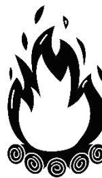
das Lagerfeuer, -