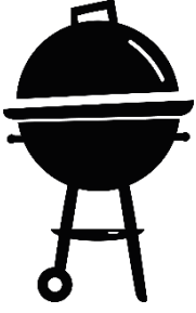
der Kugelgrill, -s