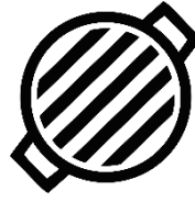
der Grillrost, -e