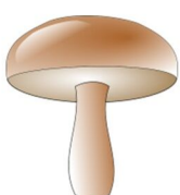
der Pilz, -e