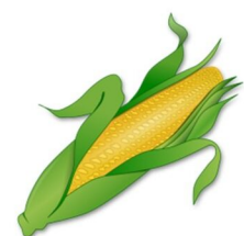
der Mais, -e