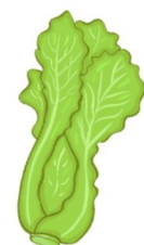
der Salat, -e