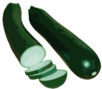
die Zucchini, -s