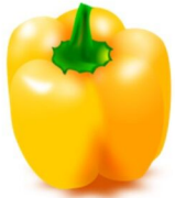
der / die Paprika, -s