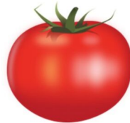
die Tomate, -n