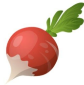
das Radieschen, --