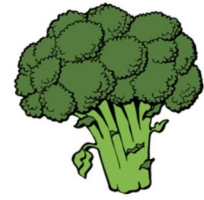
der Brokkoli, -s