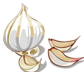
der Knoblauch, --