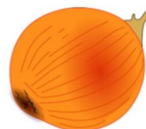
die Zwiebel, -n