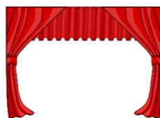
der Vorhang, -"e