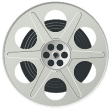
der Film, -e