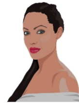
die Schauspielerin, -nen