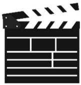
die Filmklappe, -n