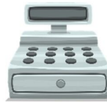
die (Kino-)Kasse, -n