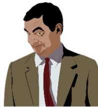
der Schauspieler, --