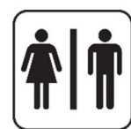
das WC, -s die Toilette, -n