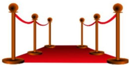
der Eingang, -"e