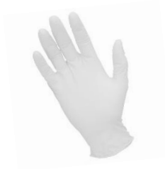
der Einmalhandschuh, -e der Einweghandschuh, -e