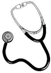
das Stethoskop, -e