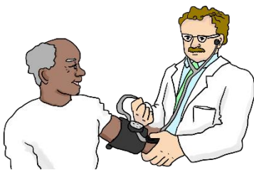
das Blutdruckmessgerät, -e