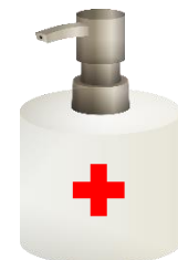
das Desinfektionsmittel, --