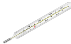
das Thermometer, --