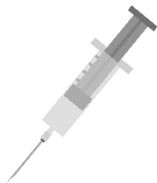
die Spritze, -n