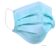
die Atemschutzmaske, -n die Mundschutzmaske, -n