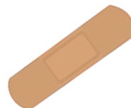
das Pflaster, --