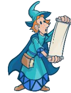
der Zauberer, --