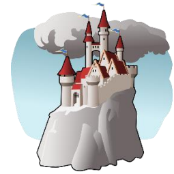
das Schloss, -"er