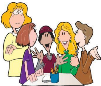
Arbeiten Sie zu viert. Arbeiten Sie in einer Gruppe von vier Personen.