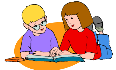
Arbeiten Sie zu zweit/ mit Ihrer Nachbarin/ Ihrem Nachbarn.