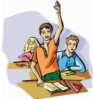
Fragen und antworten Sie.