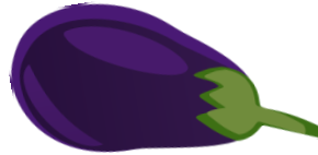
die Aubergine, -n