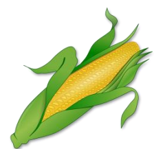
der Mais, -e