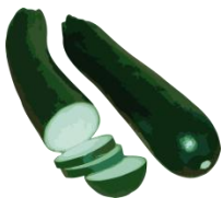
die Zucchini, -s