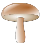
der Pilz, -e