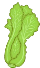
der Salat, -e