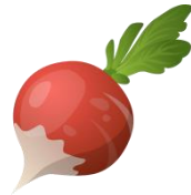
das Radieschen, --