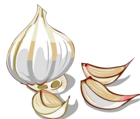
der Knoblauch, --