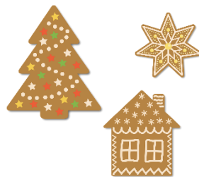
das Plätzchen, --