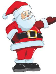
der Weihnachtsmann, -"er