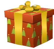
das Geschenk, -e