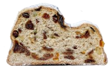
der (Christ-)Stollen, --