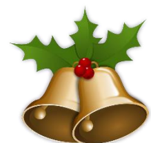
die Glocke, -n