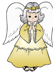
der Weihnachtsengel, --