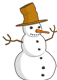
der Schneemann, -"er