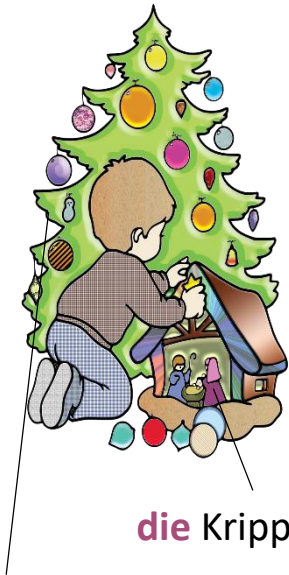
die Krippe, -n