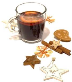
der Glühwein, -e