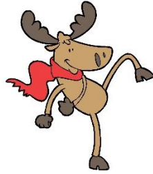
das Rentier, -e