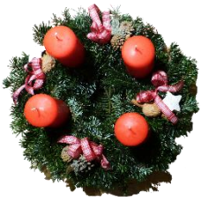
der Adventskranz, -"e